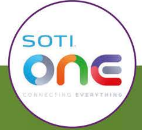
One Platform SOTI