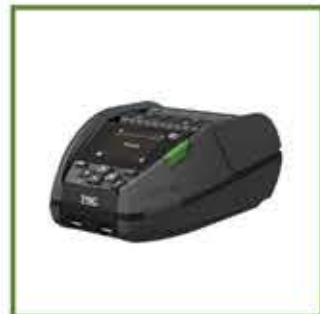
TSC Alpha 30L - Alpha 40L ve Alpha 30 R Premium Taşınabilir Direk Termal Yazıcılar

Atıkları azaltmak için linerless etiket baskısını desteklerler.