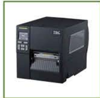
TSC MB241 Endüstriyel Barkod Yazıcı

Çevresel etkileri en aza indirecek şekilde %90'ın üzerinde geri dönüştürülebilir bileşenlere, %100 geri dönüştürülebilir ambalaj ve yazıcı kasasına sahiptir. Atıkları azaltmak için linerless etiket baskısını destekler.