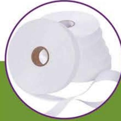
Geri Dönüşümlü Etiketlik Kumaşlar