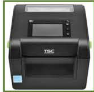
TSC DH220T ve TSC DH240T Masaüstü Barkod Yazıcılar

FSC uyumlu kartonlarla %100 geri dönüştürülebilir ambalaj %30 geri dönüştürülmüş plastikten yapılmış, %100 geri dönüştürülebilir plastik yazıcı kasası. Yazıcı bileşenlerinin %90'dan fazlası geri dönüştürülebilir. Atıkları azaltmak için linerless etiket baskısını destekler.