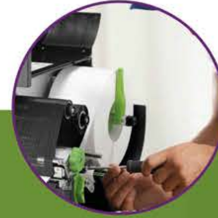
Kiralama, Yenileme ve Bakım