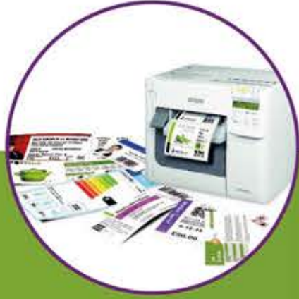
Renkli Etiket Yazıcılar