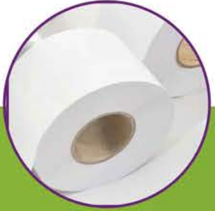
Linerless (Taşıyıcısız) Etiketler