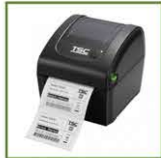
TSC DA220 Masaüstü Barkod Yazıcı

Atıkları azaltmak için linerless etiket baskısını desteklerler.