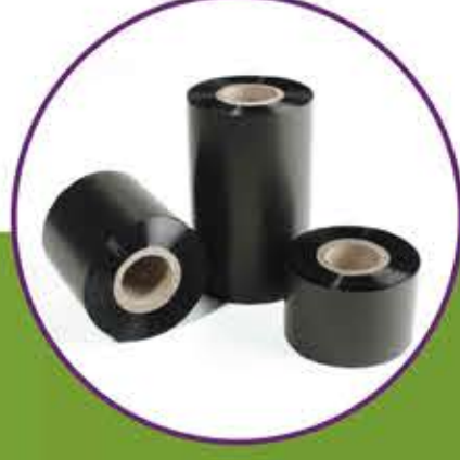
Termal Transfer Ribonlar